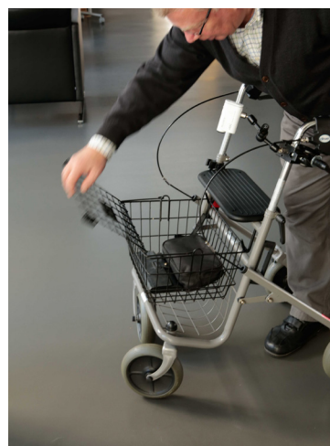
Öffnen des Korbes

Öffnen lässt sich die Korb-Abdeckung durch die schwarzen Halterungen, welche nach außen geschoben werden müssen. Außerdem befinden sich diese unterhalb der Sitzfläche, sodass ein Öffnen der Abdeckung durch fremde Personen verhindert wird. Somit ist ein sicheres Verstauen von z.B. Handtaschen und Wertgegenständen gewährleistet.